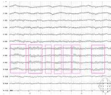
16歳 女性 安静時脳波

従来、脳波の記録は紙の上にペンで書かれていましたが、近年はデジタル処理によりコンピューター内部に記録できるようになり、当院にも導入されています